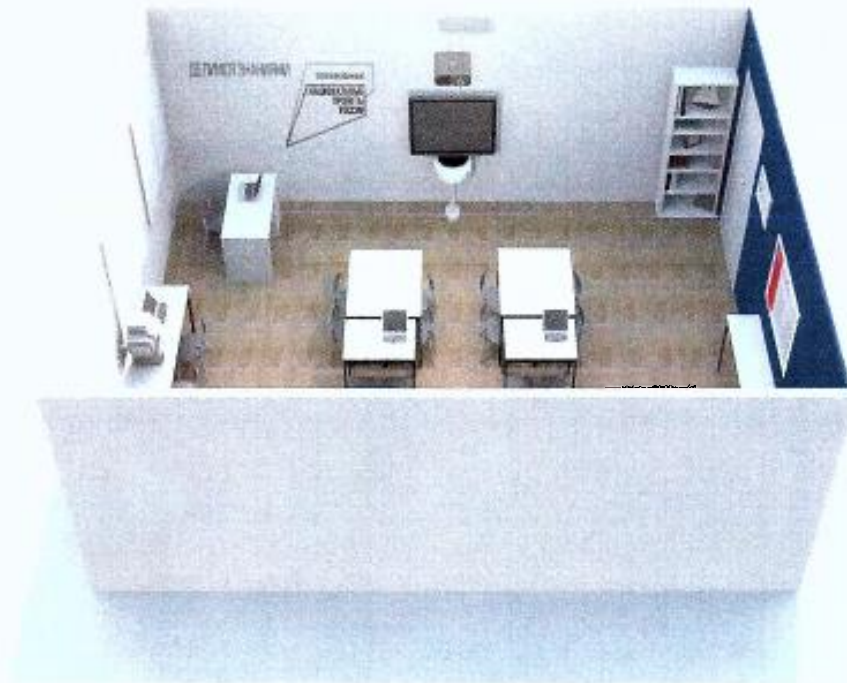
Коворкинг-зона (рекреационная зона)